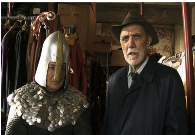
Trieste y Serbia en 2011.

MALL: Jueves 26 de mayo – 8 p.m. / Domingo 19 de mayo - 6 p.m.